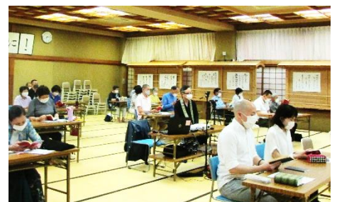
コロナ対策に間隔を空けた席配置 カメラで2階に映像を送っています

本年は、9月までの全4回開催で、第2回以降の開催日は7月30日(金)・8月27日(金)・9月24日(金)となります。いずれも19時～21時です。途中からの参加も可能ですので、ぜひ、お近くにおられる方や真宗に出遇っていただきたい方へお声掛けをお願いいたします。