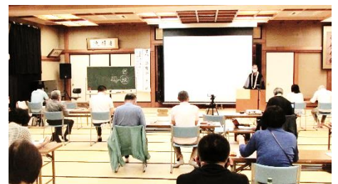
レジュメを画面に映して講義されました